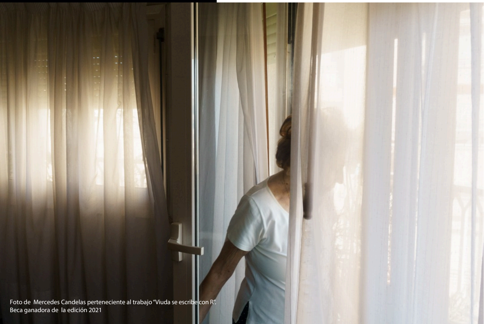
Foto de Mercedes Candelas perteneciente al trabajo "Viuda se escribe con R". Beca ganadora de la edición 2021